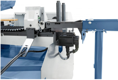
Präzisions-Linearführung mit Kugelumlaufspindel und leistungsstarkem Servo-Antrieb für höchste Positioniergenauigkeit des Werkstückes.