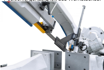
Sägebandführung über kombiniertes Rollen-Backenführungssystem mit Hartmetalleinsätzen