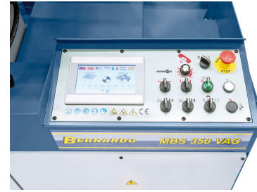
Übersichtlich aufgebautes Bedienpaneel mit integrierter NC-Steuerung.