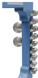
9 Stk. Formrollen und 3 Stk. obere Rollen serienmäßig, praktische Halterung zum Aufbewahren am Standfuss.