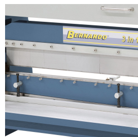
Durch die herausnehmbaren Klaviereinsätze ergeben sich eine hohe Anzahl von Biegemöglichkeiten.