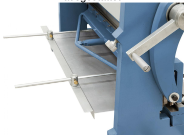
Hinteranschlag für Serienarbeiten im Lieferumfang enthalten.