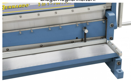
Auflagetisch mit rechtwinkeligem Anschlag auf beiden Seiten.