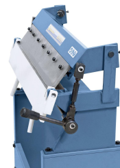
Spezielle Klemmvorrichtung für ein sicheres Klemmen.