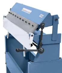
Spezielle Klemmvorrichtung für ein sicheres Klemmen.