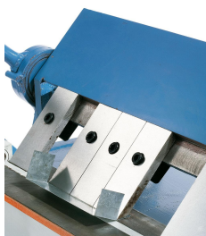
Durch die einzeln herausnehmbaren Segmente können auch Schachteln gebogen werden.