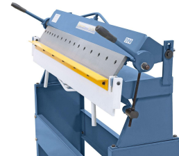
Einfaches Anheben der Oberwange mittels Hebel.