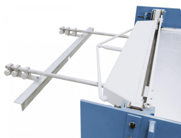
Robuster Hinteranschlag, einstellbar von 0 - 600 mm.