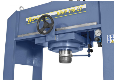
Mittels Handrad kann der Kolben nach links oder rechts verschoben werden.