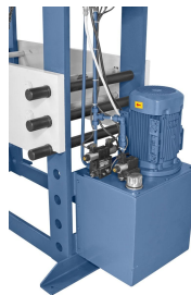
Hydraulikanlage mit hochwertigen Komponenten.