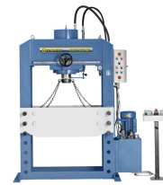
Abbildung von BRHP 200 QZ