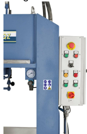
Alle Schaltelemente übersichtlich angebracht.