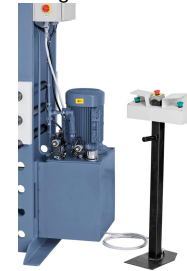
Erhöhte Sicherheit durch Zweihandbedienung und Not-Aus-Schalter im Bedienpult.