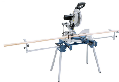
Anwendungsbeispiel mit ZKG 305 N