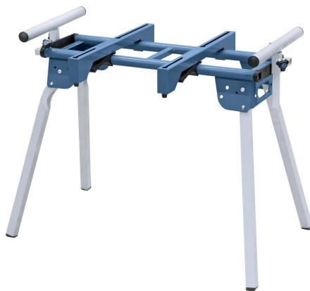
Abbildung zeigt Standard-Lieferumfang