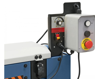
Variabel einstellbare Vorschubgeschwindigkeit.