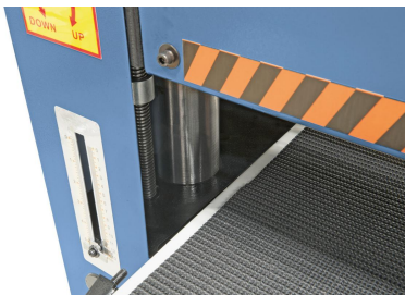
Arbeitstisch wird mittels Handrad und Skala an die Werkstückdicke angepasst.