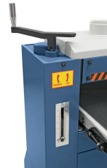
Arbeitstisch wird mittels Handrad und Skala an die Werkstückdicke angepasst.