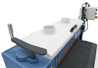
Serienmäßig mit Absaugstutzen für einen sauberen Arbeitsplatz.