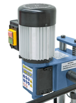
Leistungsstarker Aluminiummotor nach IP54