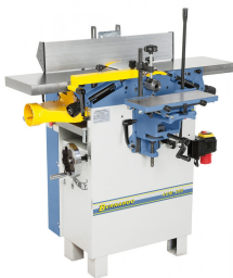
Auf Wunsch mit Langlochbohrereinrichtung lieferbar (nur in Verbindung mit Maschine).