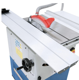
Der Sägeblattschutz mit integriertem Absaugstutzen ist am Spaltkeil befestigt.