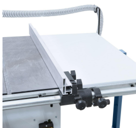
Präzise Führung des Aluminium-Parallelanschlages mittels 30 mm Rundstange.