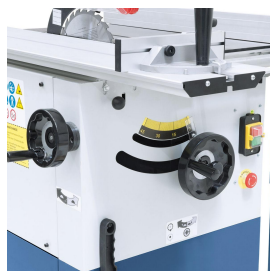
Die Höhenverstellung bzw. Schwenkung des Sägeaggregates erfolgt mittels ergonomisch angebrachten Handrädern.