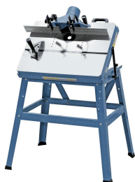
Für ein leichteres Montieren der Oberfräse