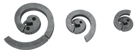
3 Stk. Spiralbiegeaufsätze im Lieferumfang enthalten