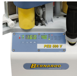
Übersichtliches Bedienpaneel, Bedienung über Folientastatur.