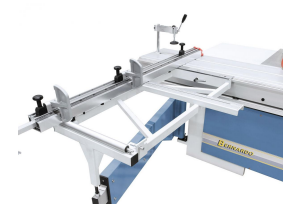
Beidseitig verwendbare Längs-Anschlagklappe für exaktes Einstellen der Schnittbreite am Teleskopanschlag.