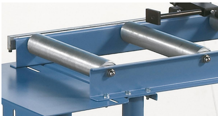
Beidseitig kugelgelagerte Stahlrollen für hohe Belastbarkeit