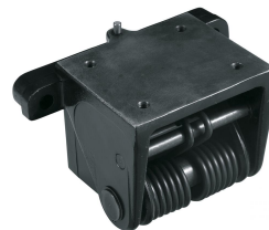
Ideal auf Tischfräsen zum einfachen Abklappen des Vorschubes (Option)