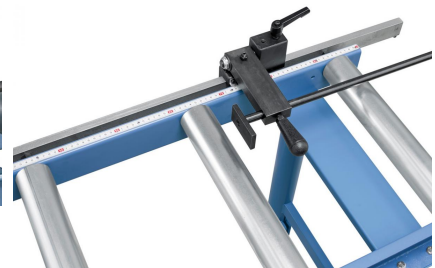
Durch die mm-Skala kann die gewünschte Schnittlänge exakt eingestellt und abgelesen werden