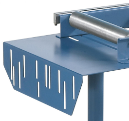
Serienmäßig mit Montageplatte