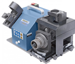
Schleifen der Anschnittlänge