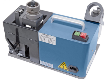
Schleifen der Schneide