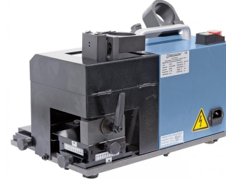
Schleifen der Stirnfläche