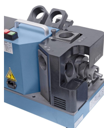
Schleifen der Schneidkante 1 und 3