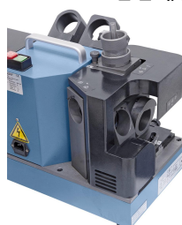
Schleifen des Freiwinkels bei 2-schneidigem Fräser