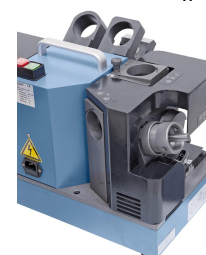
Schleifen des Freiwinkels bei 3- und 4-schneidigem Fräser