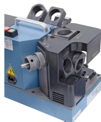
Schleifen des Spitzenwinkels