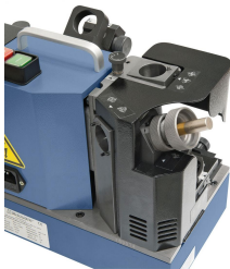
Schleifen des Freiwinkels bei 2-schneidigem Fräser