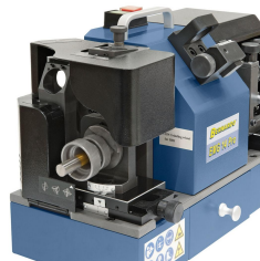
Schleifen des Spitzenwinkels