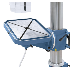
Der großzügig dimensionierte Bohrtisch ist von -45° bis +45° schwenkbar sowie drehbar.