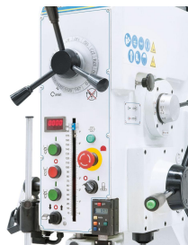
Massiver Getriebekopf mit ergonomisch angebrachten Schalt- und Bedienelementen. Digitalanzeigen für Bohrtiefeneinstellung und Drehzahl sind serienmäßig enthalten.