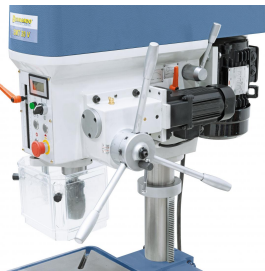
Stufenlos einstellbarer Pinolenvorschub mit separatem Antriebsmotor.