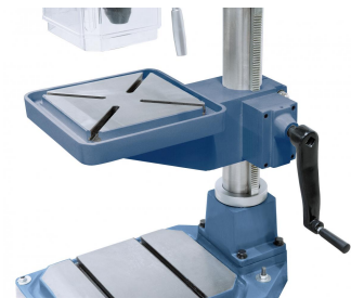
Geschliffener Arbeitstisch mit diagonal verlaufenden T-Nuten.