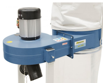
Kratz- und stoßfeste Oberfläche durch hochwertige Pulver- beschichtung