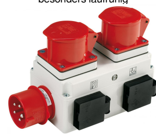
Einschaltautomatik ALV 10 / 1 M: Beim Ein- bzw. Ausschalten der Holzbearbeitungsmaschine wird die Absauganlage mit Zeit- verzögerung zu- bzw. abgeschaltet (Option).