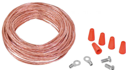
Erdungsset ES 1 (optional): Achtung! Die Absauganlage sollte immer geerdet werden, ansonsten besteht Feuer- und Explosionsgefahr!