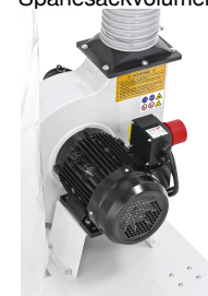
Leistungsstarker Aluminium-Motor, besonders laufruhig