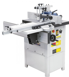
Der Rolltisch (Option) erhöht den Einsatzbereich der Maschine.