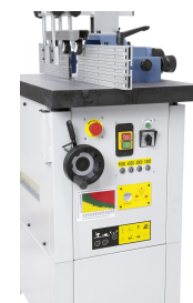
Alle wesentlichen Schalt- und Bedienelemente sind auf der rechten Maschinenseite angeordnet.