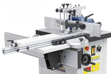
Der Rolltisch (Option) erhöht den Einsatzbereich der Maschine.