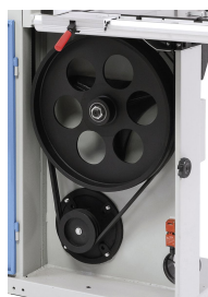
Die robuste Keilriemenscheibe und der hochwertige Keilriemen sorgen für eine optimale Kraftübertragung vom Motor