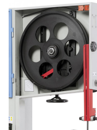
Dynamisch ausgewuchtete Laufräder aus Grauguss sorgen für einen ruhigen Lauf.