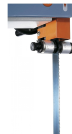
Optimale Führung des Sägebandes durch die wartungsfreie Präzisionsrollenführung