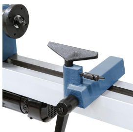
Serienmäßig mit Handauflage 110 mm bzw. 175 mm.