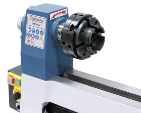
Selbstzentrierendes Spannfutter 40/70 (Option)