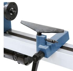
Serienmäßig mit Handauflage 110 mm bzw. 175 mm.