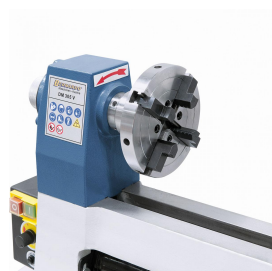
4-Backen-Spannfutter 125 mm / M 33 x 3,5 mm (Option)