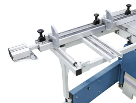
Der über die gesamte Schlittenlänge verschiebbare, massive Auslegertisch kann in jeder Position abgenommen werden. Der ausziehbarer Teleskopanschlag mit 2 massiven Klappanschlägen ist millimetergenau