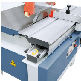
Der großzügig dimensionierte Formatschiebeschlitten läuft leichtgängig und absolut verschleißfrei auf einer gehärteten Prismenführung.