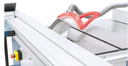
Das bis 45° schwenkbare Sägeaggregat kann mittels Handrad für Schnitthöhen bis 100 mm eingestellt werden.