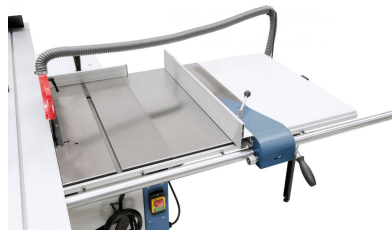
Der Parallelanschlag mit stabiler Rundstangenführung (40 mm) ist für Schnittbreiten bis 1200 mm verwendbar.