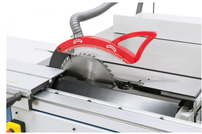
Serienmäßig mit Vorritzaggregat für ein ausreißfreies Bearbeiten von Plattenwerkstoffen.