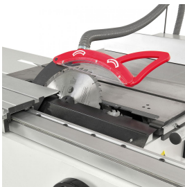
Der Sägeblattschutz mit integriertem Absaugstutzen ist am Spaltkeil befestigt. Serienmäßig mit Vorritzaggregat ausgestattet.