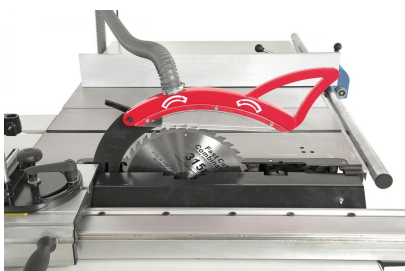
Serienmäßig mit Vorritzaggregat für ein ausreißerfreies Bearbeiten von Plattenwerkstoffen.