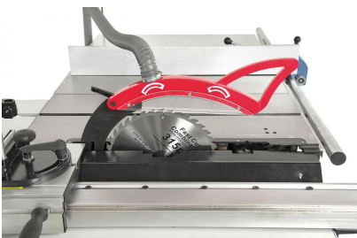
Serienmäßig mit Vorritzaggregat für ein ausreißerfreies Bearbeiten von Plattenwerkstoffen.