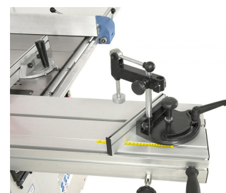
Eine in den Tisch eingearbeitete Skala ermöglicht ein exaktes Einstellen des Gehrungsanschlages.