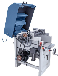
Der Kettenantrieb sorgt für einen gleichmäßigen Antrieb der Ein- und Auszugswalze.