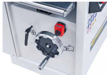
Die Einstellung der Dickentischhöhe erfolgt mittels digitaler Anzeige auf 1/10 mm genau.