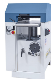
Stabiler Dickentisch mit Pinolenführung und Abstützung für exaktes Hobeln von Bretter, Leisten, Bohlen, ...