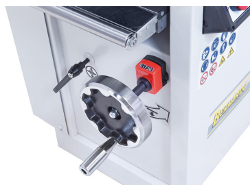
Die Einstellung der Dickentischhöhe erfolgt mittels digitaler Anzeige auf 1/10 mm genau.