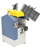
Einfaches und sekundenschnelles Umrüsten vom Abrichten zum Dickenhobeln durch aufklappbare Abrichttische