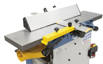
Der massive, bis 45° schrägstellbare Abrichtanschlag mit Prismenführung ist leicht verstellbar