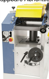
Dickentisch mit mittiger Säulenführung und Abstützung für plangenaues Hobeln.