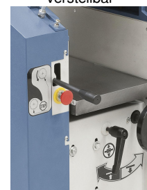
Vorschub ist zum Abricht Hobeln ausschaltbar.