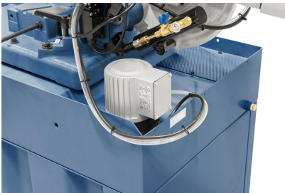
Leistungsstarke Kühlmittelpumpe im Lieferumfang enthalten.