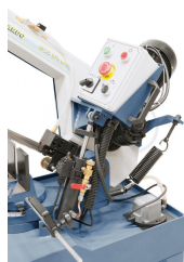
Hydraulikzylinder für stufenloses Absenken des Sägebügels.