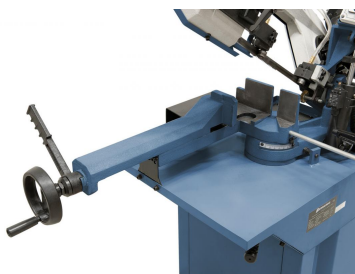
Der massive Schraubstock aus Grauguss ist mit einer Schnellarretierung ausgestattet - optimal für Serienarbeiten.