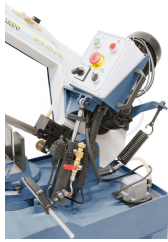
Hydraulikzylinder für stufenloses Absenken des Sägebügels.