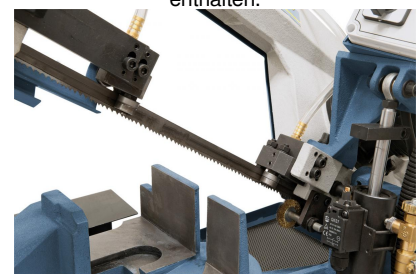
Kugelgelagerte Sägebandführung für präzise Schnitte