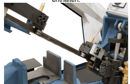
Kugelgelagerte Sägebandführung für präzise Schnitte