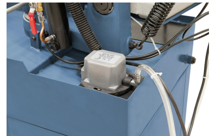
Kühlmiteleinrichtung im Lieferumfang enthalten.