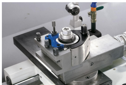
Der Schnellwechselstahlhalter System Multifix ermöglicht eine Reduzierung der Nebenzeiten und gewährleistet eine hohe Wiederholgenauigkeit.