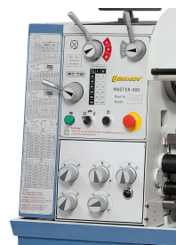
Übersichtlich angebrachte Schaltelemente am Getriebekopf, gehärtete und geschliffene Zahnräder sorgen für einen ruhigen Lauf.