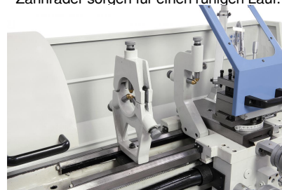
Zum Stabilisieren von langen Werkstücken serienmäßig mit einer feststehenden bzw. mitlaufenden Lünette ausgestattet.