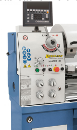
Leichtgängige Vorschub- und Drehzahlregelung am Getriebekopf, ruhiger Lauf durch gehärtete und geschliffene Zahnräder, im Ölbad laufend.