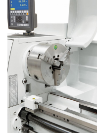
Vorteil des Bernardo-Backenfutters DK11-200 mm / D5: Monoblock-, Grund-, Umkehr- und Aufsatzbacken lieferbar.