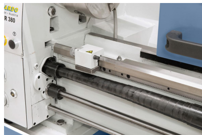
Mikrometerlängsansschlag und Rutschkupplung im Lieferumfang enthalten.