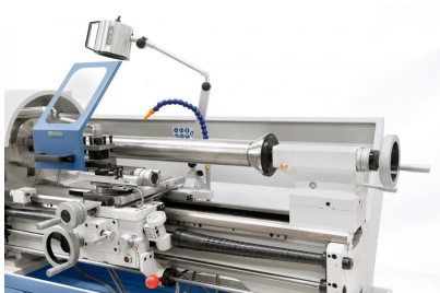
Zentrierkegel diam. 125 mm, ideal zum Spannen von Rohren und Hohlkörpern (Option).