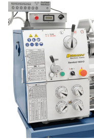
Einfache Bedienung, alle Schalt- und Bedienelemente übersichtlich am Getriebekopf angebracht