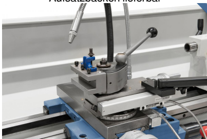
Zum rationellen Arbeiten ist die Maschine serienmäßig mit einem Schnellwechselstahlhalter ausgerüstet