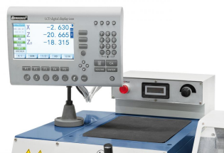
Elektronisch, stufenlose Drehzahlregelung, leichtes Ablesen mittels Digitalanzeige.