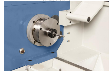
Das Spannzangenfutter ER 25 gewährleistet eine hohe Rundlaufgenauigkeit beim Spannen von Werkstücken, Spannbereich 1 - 16 mm