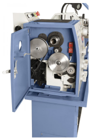
Lieferumfang komplett mit Wechselräder zum Gewindeschneiden