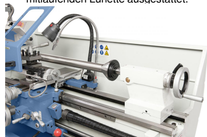
Zentrierkegel diam. 100 mm, ideal zum Spannen von Röhren und Hohlkörpern (Option)