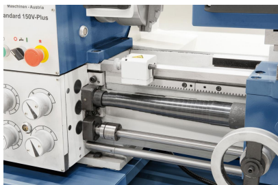
Mikrometerlängsanschlag und Rutschkupplung im Lieferumfang enthalten