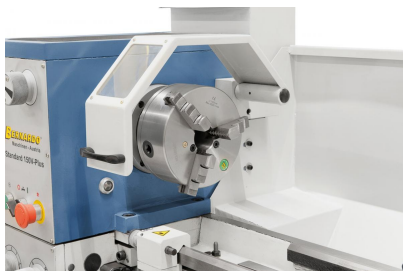
Vorteil des Bernardo-Backenfutters DK11-160 mm: Monoblock-, Grund-, Umkehr- und Aufsatzbacken lieferbar