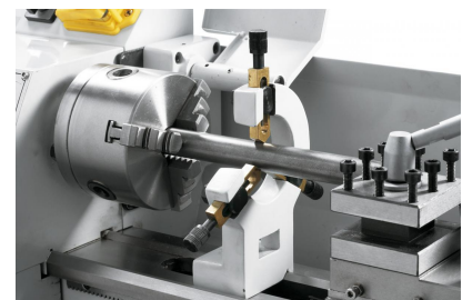
Feststehende Lünette mit Bronzeführung zum Stabilisieren von langen Werkstücken.