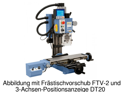
Abbildung mit Frästischvorschub FTV-2 und 3-Achsen-Positionsanzeige DT20