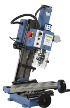
KF 20 mit geschwenktem Fräskopf für erweiterten Einsatzbereich (Standard)