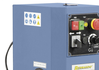
Handliche Anordnung der Schaltelemente am Fräskopf