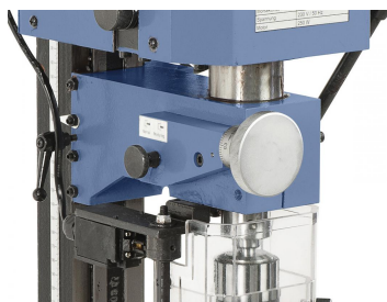
Pinole mit Feinzustellung für präzises Arbeiten