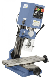
KF 10 L mit geschwenktem Fräskopf für erweiterten Einsatzbereich (Standard)