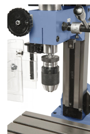
Optional mit Schnellspannbohrfutter 1 - 10 mm / B 12