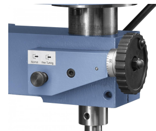
Pinole mit Feinzustellung für präzises Arbeiten