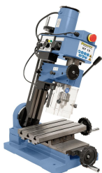
KF 10 mit geschwenktem Fräskopf für erweiterten Einsatzbereich (Standard)