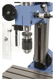
Optional mit Schnellspannbohrfutter 1 - 10 mm / B 12