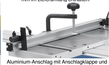
Aluminium-Anschlag mit Anschlagklappe und Niederhalter im Lieferumfang enthalten.